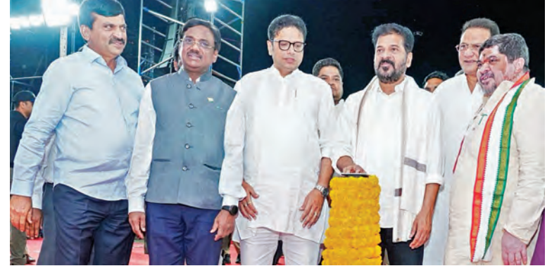
సోమవారం హైదరాబాద్ లో యంగ్ ఇండియా ఇంటిగ్రేటెడ్ స్కూళ్లకు శంకుస్థాపన చేస్తున్న సీఎం రేవంత్. చిత్రంలో మంత్రులు పొంగరేటి, వివేక్, శ్రీధర్బాబు, అజారుద్దీన్, పాస్కుల

యంగ్ ఇండియా ఇంటిగ్రేటెడ్ స్కూళ్లకు శంకుస్థాపన