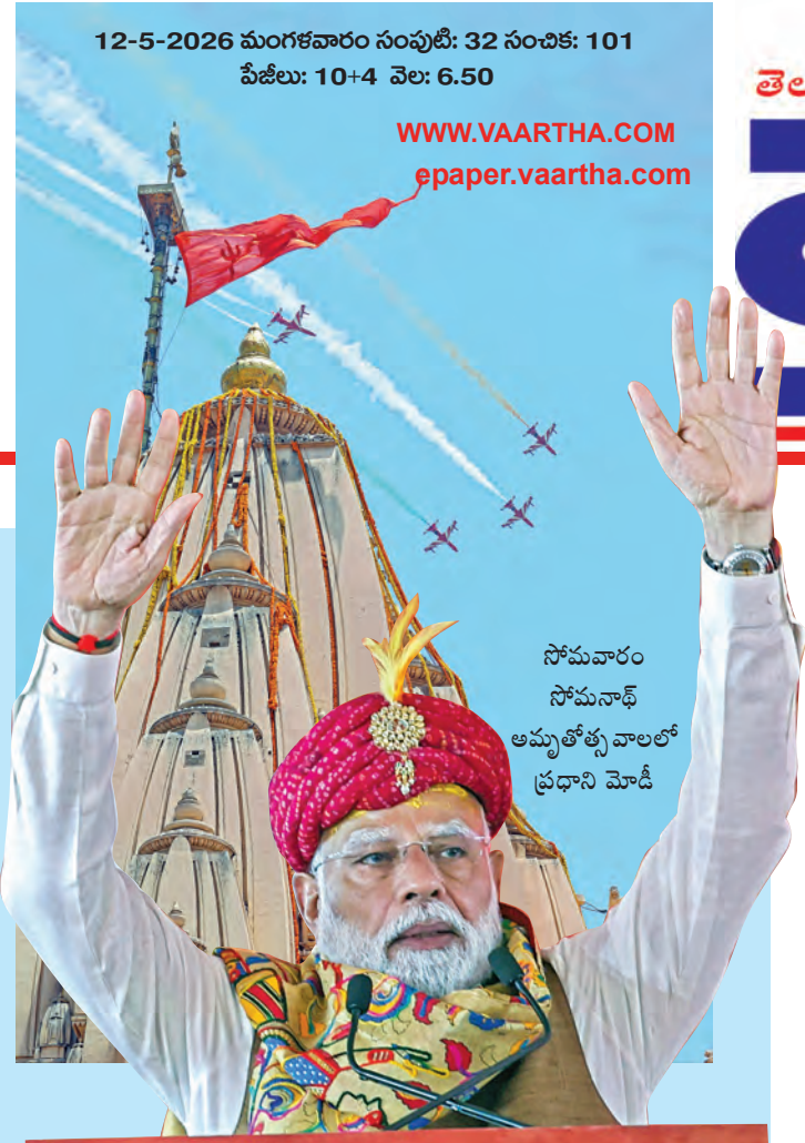
సోమవారం సోమనాథ్ ఆమ్మతోళ్ళవాలలో ప్రధాని మోడీ