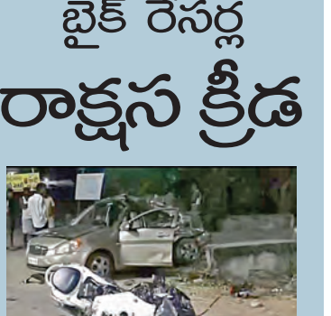
మహాబాబ్ నగర్ లో ప్రమాదానికి గురైన కారు, స్పాన్స్ బైక్

కారును ఢీకొన్న స్పాన్స్ బైక్ లు టి కుటుంబంలోని ఐదుగురు దుర్మరణం మృతుల్లో ఇద్దరు చిన్నారులు