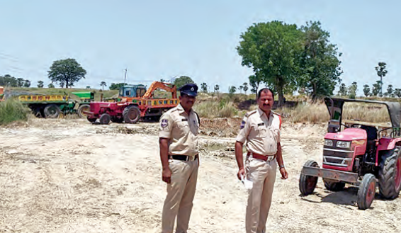
పోలీసులు ఆరుగురు వ్యక్తులను అరెస్టు చేసి ట్రాక్టర్లు మరియు జెనిబలను స్వాధీనం చేసుకున్నారు.

హైదరాబాద్, మే 11, ప్రభాతవార్త: నిజామాబాద్ వాగులో మొరం తవ్వుతున్న వ్యక్తులను అరెస్టు చేసి ట్రాక్టర్లు మరియు జెనిబలను స్వాధీనం చేసుకుంది. పోలీసులు ఆరుగురు వ్యక్తులను అరెస్టు చేసి ట్రాక్టర్లు మరియు జెనిబలను స్వాధీనం చేసుకున్నారు.