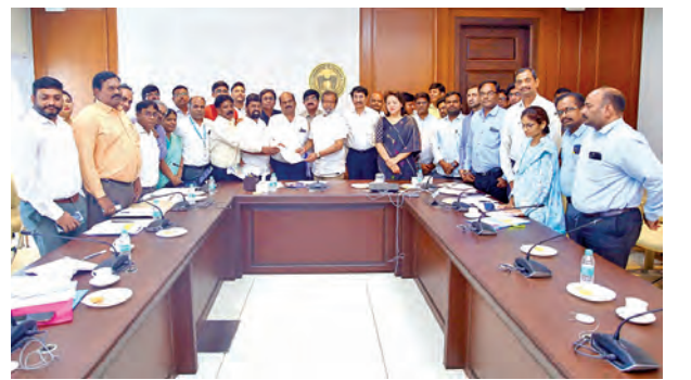
పూర్తిస్థాయి వైద్య సేవలు అందించేలా సనత్ నగర్ టిమ్స్ ను తీర్చిదిద్దాలి అధికారులను ఆదేశించిన ఆరోగ్య శాఖ మంత్రి దామోదర రాజనల్లం

సెర్టిఫైడ్, పీవీఎన్ఆర్టియూ మధ్య అవగాహనా బస్టండ్ మహిళల ఆదాయ వనరులు పెంచడమే లక్ష్యం : మంత్రి సీతక్క వంటి కార్యక్రమాలకు ఆర్థిక సహాయం అందించబడుతుంది. అవగాహన బస్టండ్ల ద్వారా గ్రామీణ మహిళలకు ప్రత్యేకంగా పాఠశాలలు, వైద్య సౌకర్యాలు, విద్యుత్ సౌకర్యాలు మరియు ఉద్యోగ అవకాశాలను సృష్టించాలి. ఈ పథకం ద్వారా గ్రామీణ మహిళల ఆర్థిక స్థిరత్వం పెరుగుతుంది మరియు వారి జీవనం మెరుగుపడుతుంది.