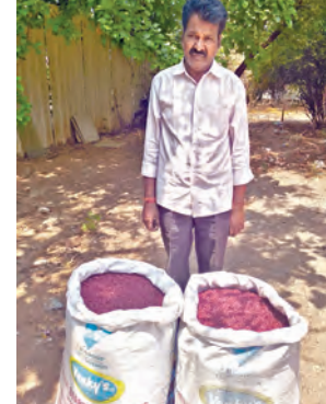
నిషేధిత బిటి-3 పత్తి విత్తనాలను అక్రమంగా రవాణా చేయడం నిషేధించబడింది. మంత్రి దామోదర రాజనల్లం ఆదేశించారు.

హైదరాబాద్ (నేరేడ్ మెట్, మరాఠీగిరి కమిషనరీ), మే 11, ప్రభాతవార్త: రైతులను మోసగించే యత్నం భంగం తెచ్చాలి. పాపీర్ పేజీలలో నిషేధిత బిటి-3 పత్తి విత్తనాలను అక్రమంగా రవాణా చేయడం నిషేధించబడింది. మంత్రి దామోదర రాజనల్లం ఆదేశించారు.